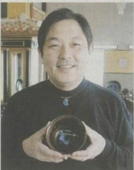
「耀変珽玻天目」を示す金子当主「石垣市名蔵・石垣焼窯元」

現在、同天目2点を保管している一方、再現には成功していない。「耀変は人間が知り得ない領域にあるのかも」と苦笑いしながらも「今後も国宝を目標に頑張りたい」と意欲を示した。